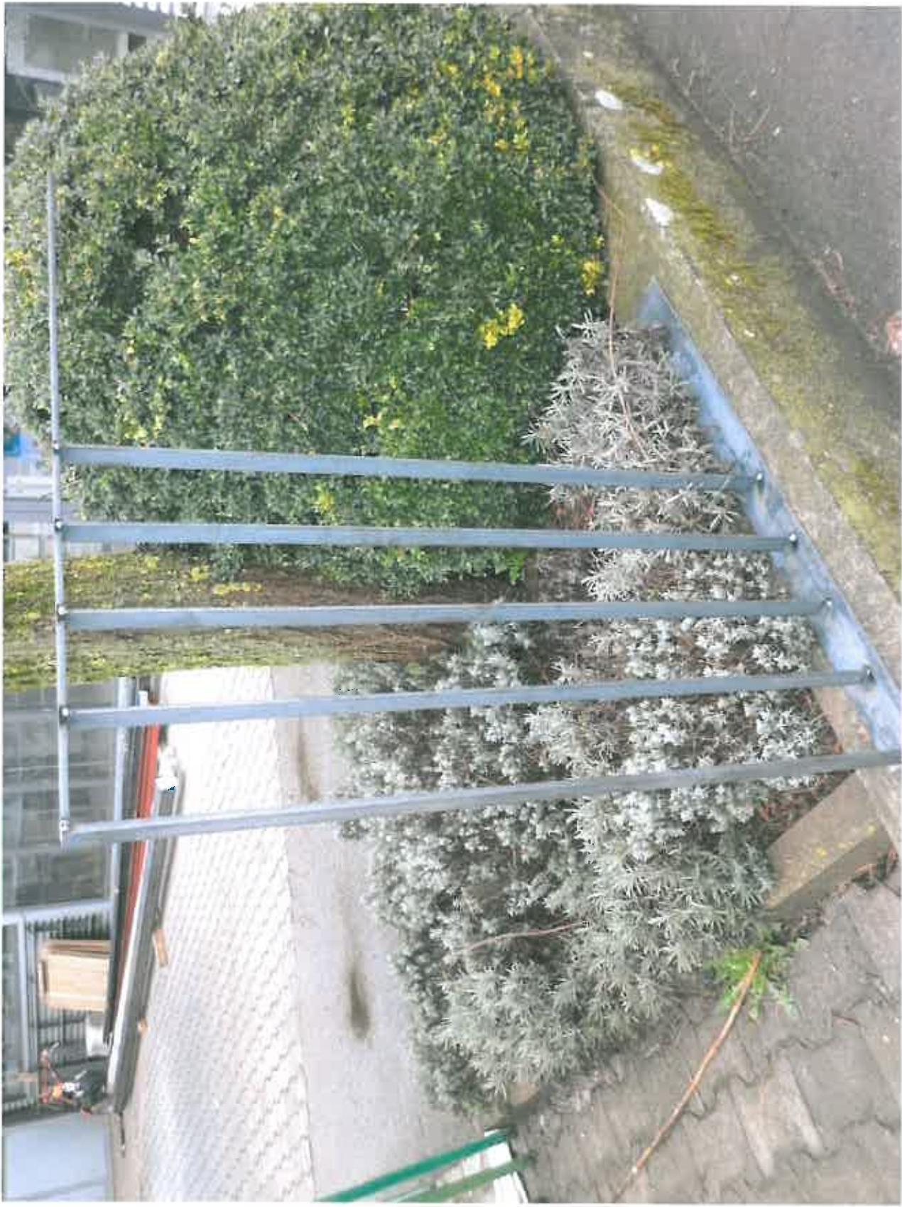
Kostengünstigere Absturzsicherung (Modell)