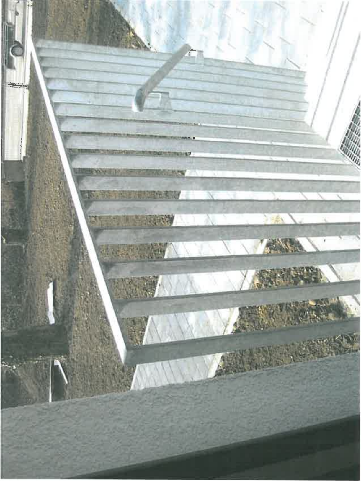
Erste Planung einer Absturzsicherung