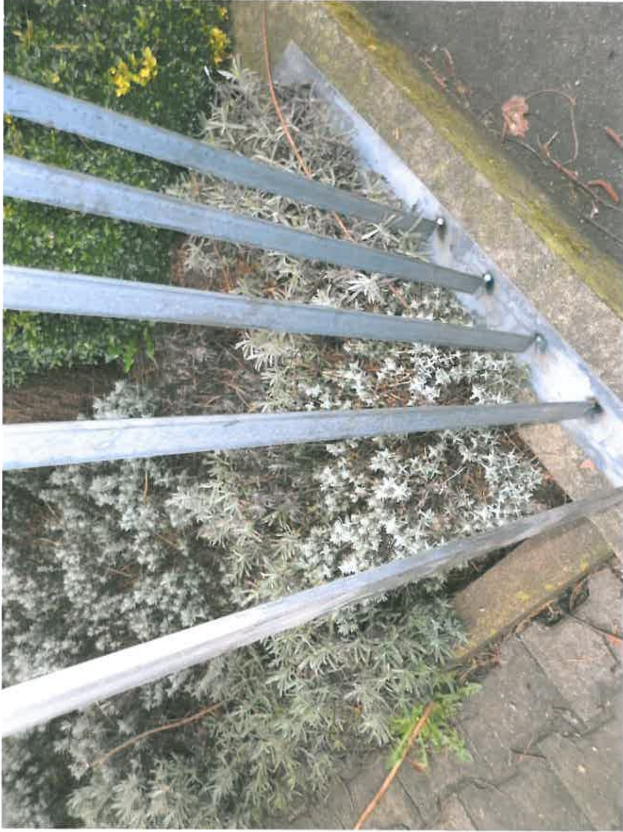
Detail: Montage auf Mauer